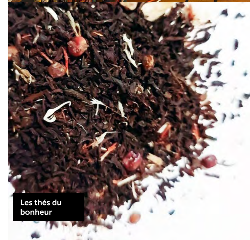
Les thés du bonheur