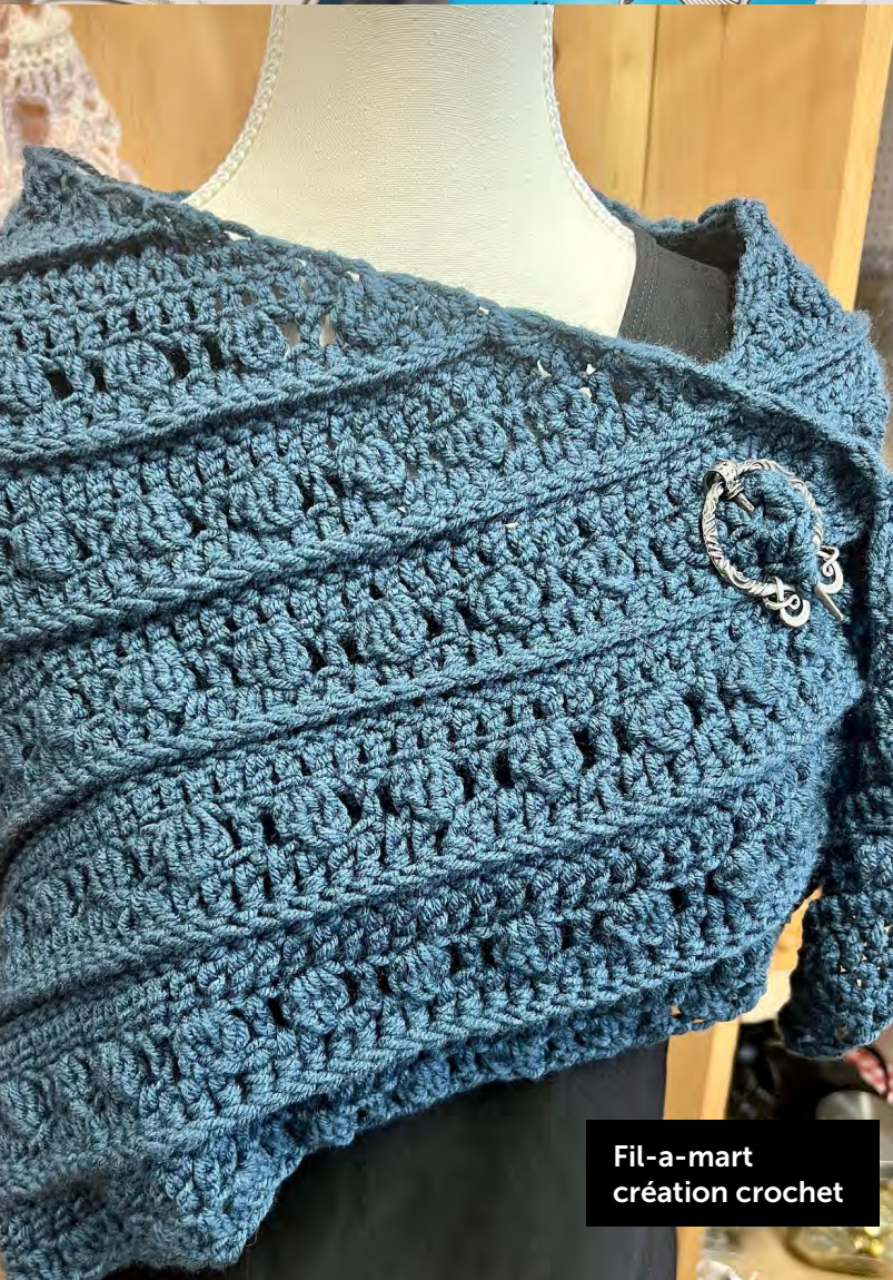
Fil-a-mart création crochet