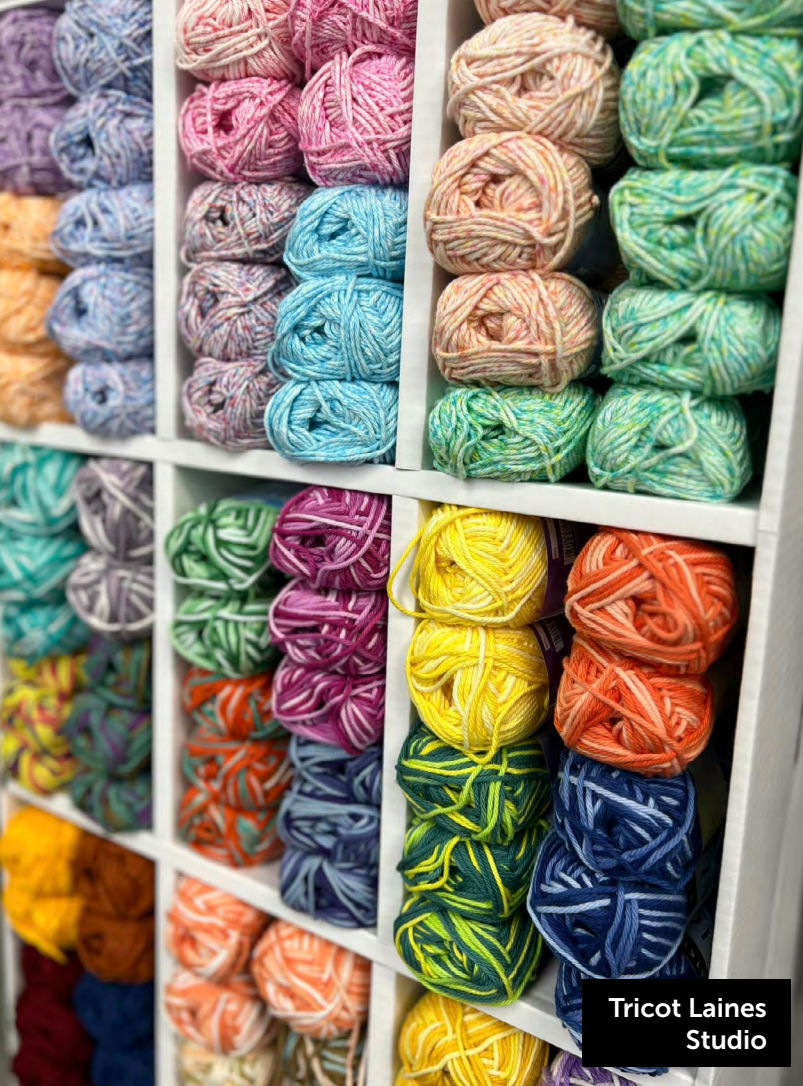
Tricot Laines Studio