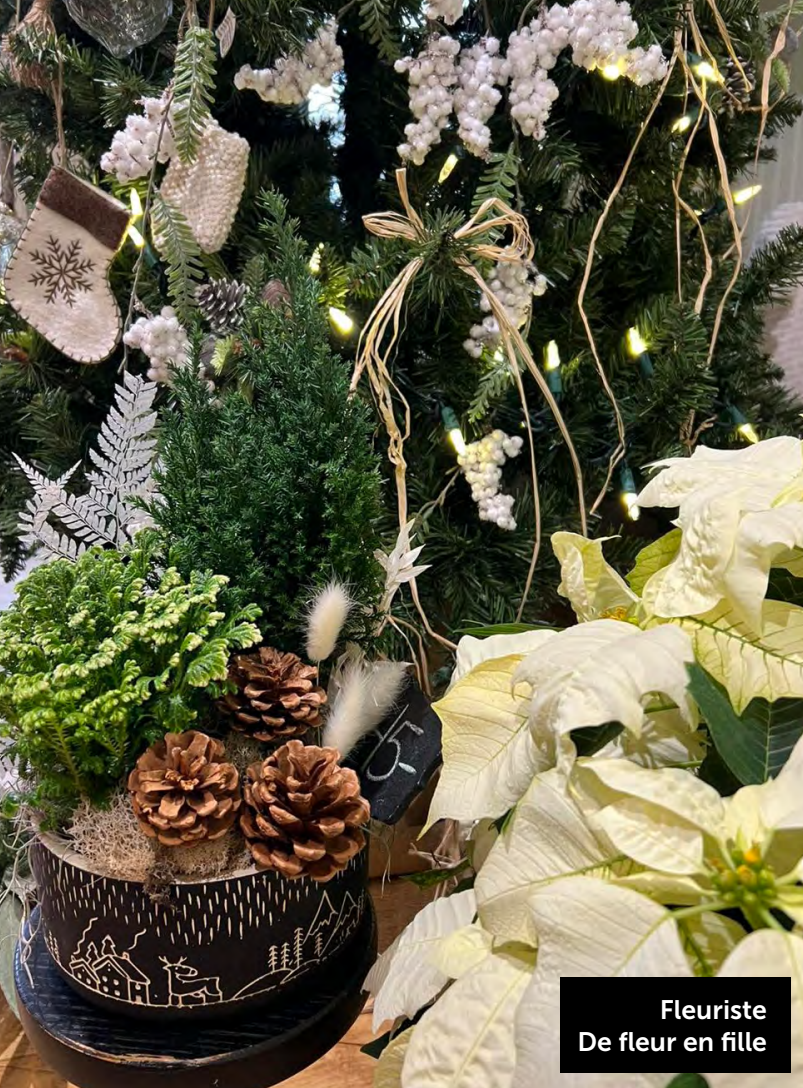
Fleuriste De fleur en fille