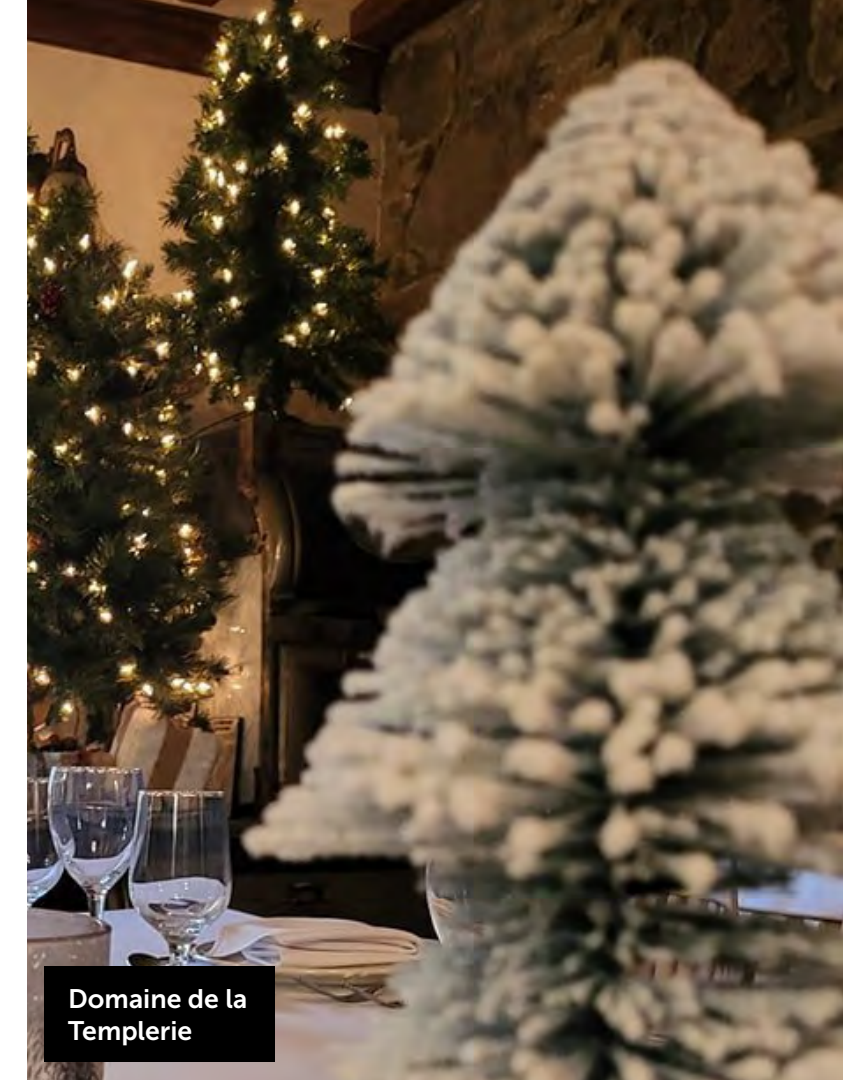
Domaine de la Templerie