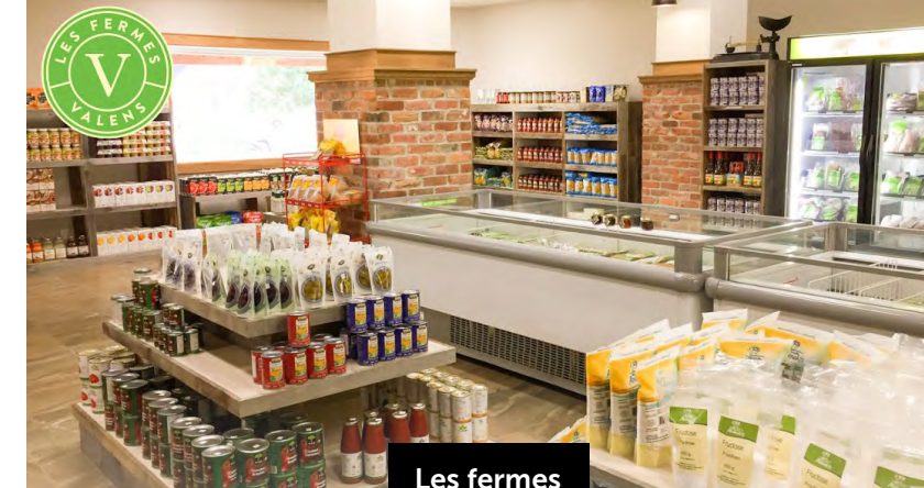
Les fermes Valens Inc.