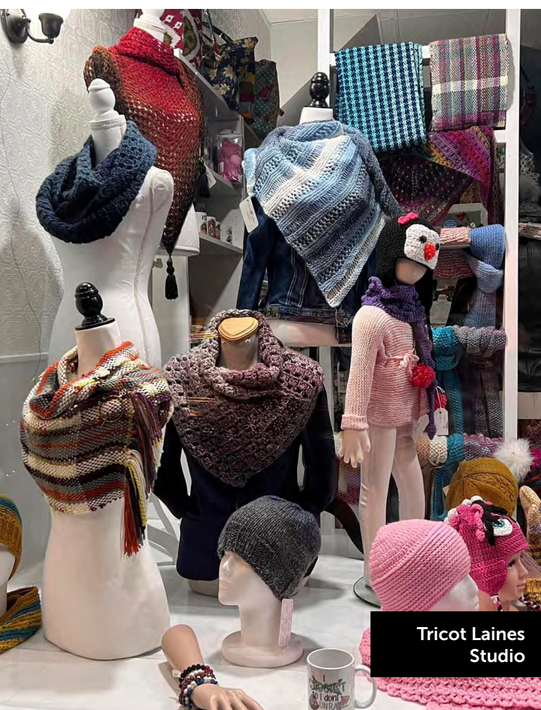
Tricot Laines Studio