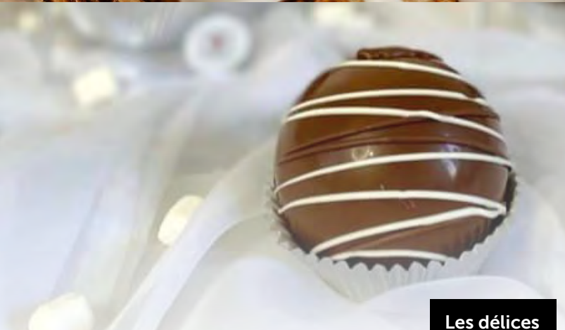
Les délices à Caro