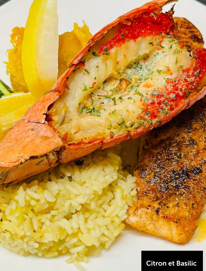
Citron et Basilic