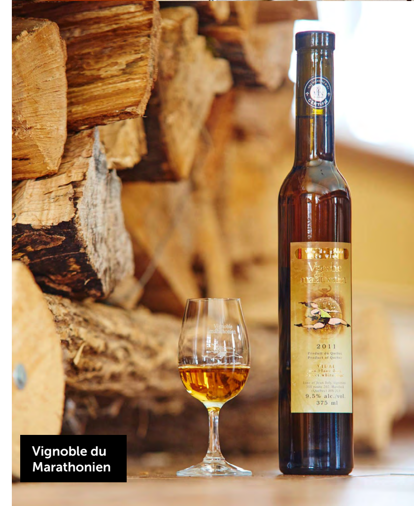
Vignoble du Marathonien