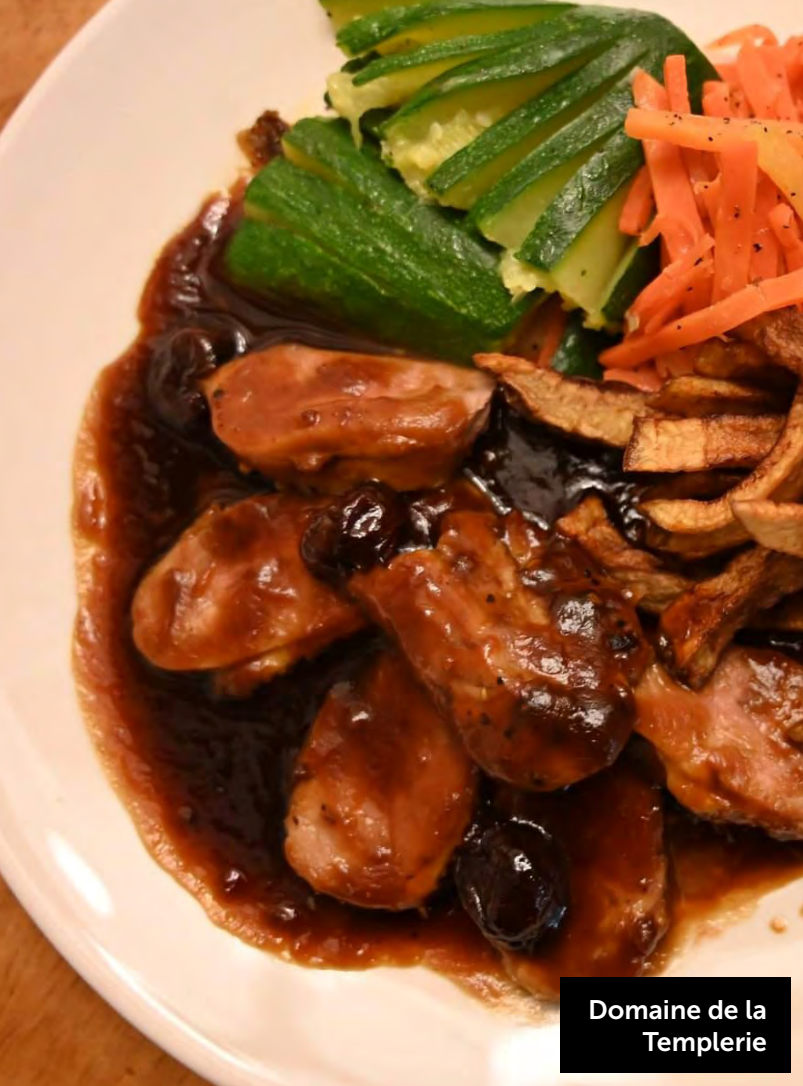
Domaine de la Templerie