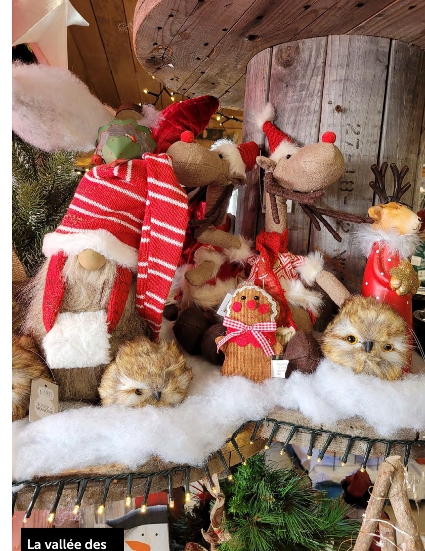
La vallée des vivaces