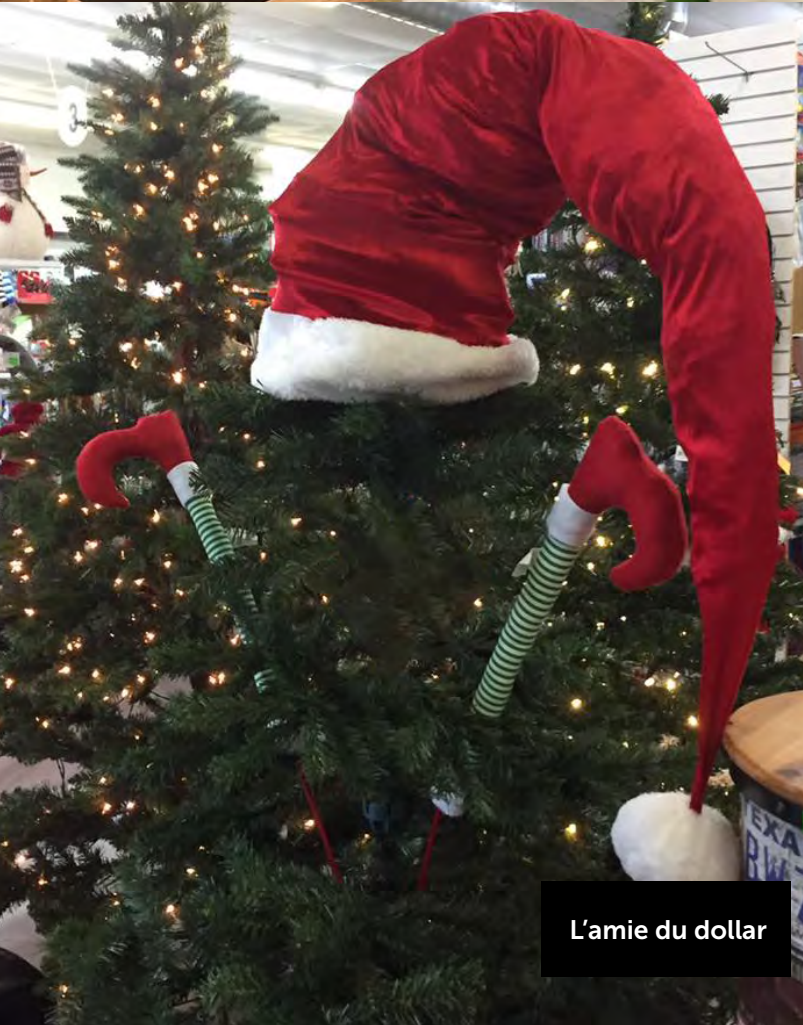
L'amie du dollar